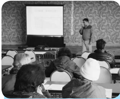
カルビーポテト 担当者による説明