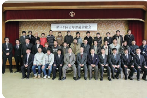
出席者全員でパチリ！