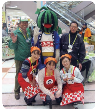
とみちゃんも応援に駆けつけました

※今後の女性部の活動につきましては、4月5日(金)の役員支部長会議にて決定した後、ご報告いたします。