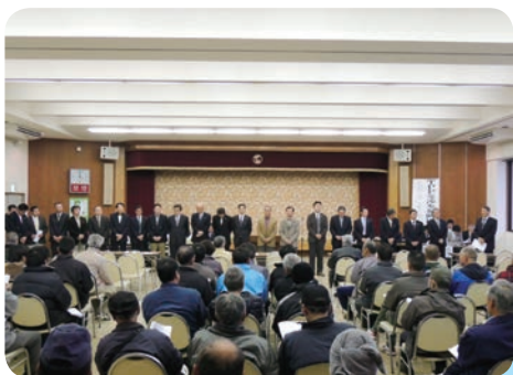
各部会の役員の紹介

今年もG A Pの普及に取り組み、「安全・安心」な農作物の栽培と信頼される産地づくりを推し進める事を確認しました。