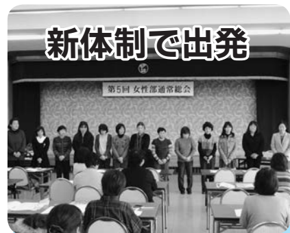
三役と各支部役員の方々