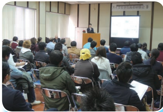
北川氏の講演に耳を傾ける若手生産者

印旛農業事務所は12月14日(水)、富里中央公民館大会議室でスイカ若手生産者研修会を開催しました。