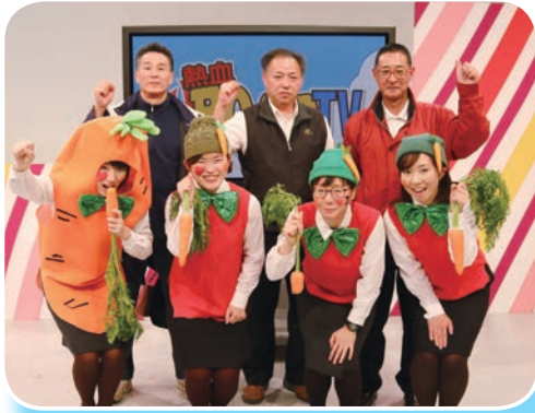
3 J Aの女性職員がアピール