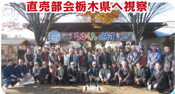
直売部会の皆さんで記念撮影

J A直売部会は11月22日(火)、栃木県宇都宮市で視察研修を行い、56人が参加しました。