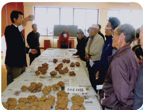
現品査定で出荷基準を確認