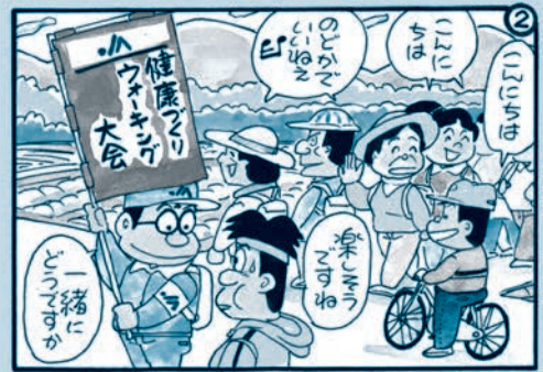
耕そう、大地と地域のみらい。