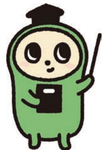
日本語検定公式キャラクター にほごん