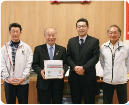
80株のオーナーが決まりました。