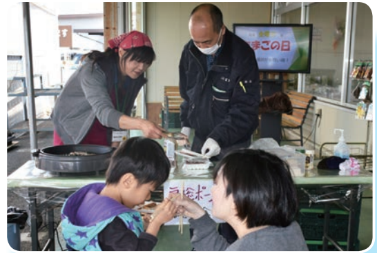
やっぱりおいしい房総ポーク