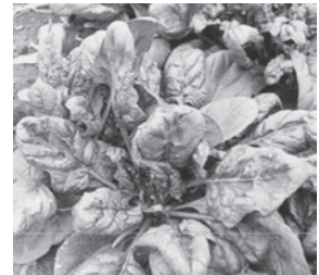
ケナガコナダニによる葉の委縮

○お問合わせ先 JA富里市 営農指導課 0476-93-5652 / 購買生活課 0476-93-1911