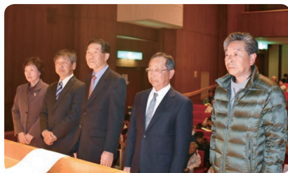
表彰された皆さん