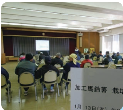
栽培にあたっての注意点などを確認

またJ A 担当者からは、6月16日出荷分までは奨励金の対象となるが、事前の申込みが必要となる為、出荷が可能な生産者は申込みを忘れないよう注意して欲しいと話しました。