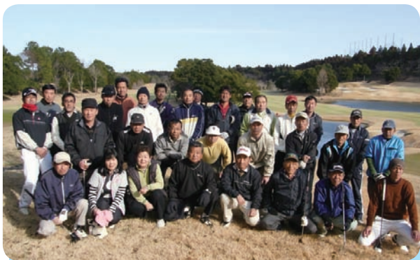
スタート前の全体写真