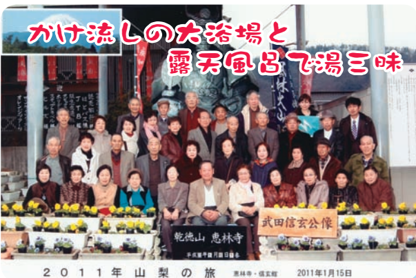
2011年山梨の旅 2011年1月15日

J A 年金友の会は、1月12日(水)から3泊4日で、山梨県の石和温泉で湯治を行いました。