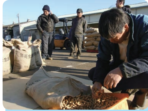
手に取り確認する検査員