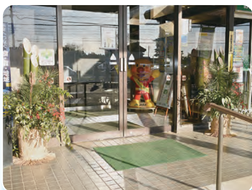
今年も華やかに彩られた正面玄関