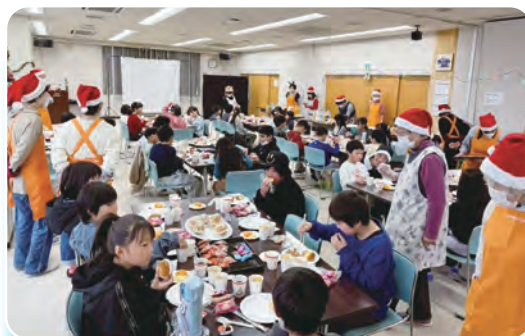
たくさんの料理を楽しみました

JAではJA自己改革の一環として、JA共済連の「地域・農業活性化積立金」を活用し地元食材を子ども食堂に提供しています。