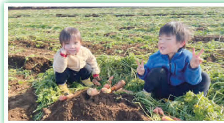
農業とともにある、子どもたちの笑顔