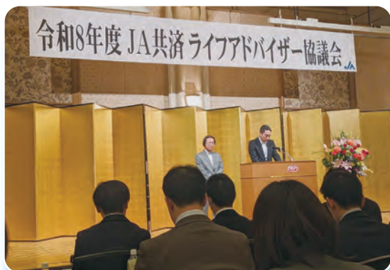
決意表明を行う宮内職員

さらに、現役ライフアドバイザーによるパネルディスカッション等もあり、有意義な時間となりました。