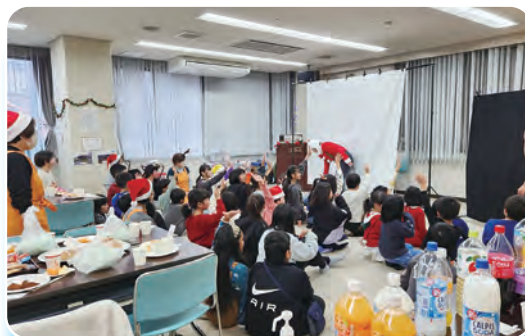
イベントに参加する小学生たち