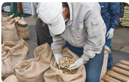
種子の状態を確認