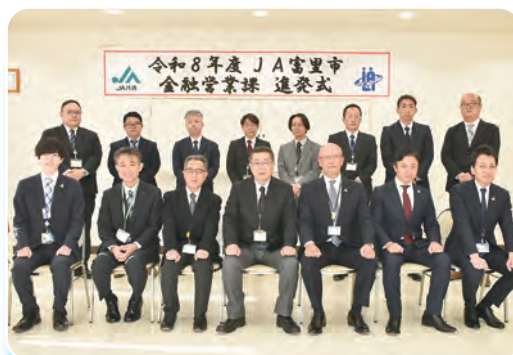
気持ち新たに進発式を行った職員

金融営業課では、引き続き「3Q訪問」を通じて、組合員・利用者の皆様との対話を大切にし、安心をお届けするとともに、お客様のニーズに合った情報やサービス提供に努めてまいります。