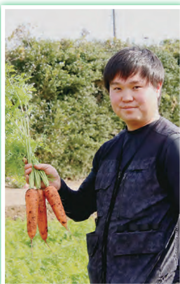
経営の柱となっているニンジン

現場では、重い作業や汚れる仕事も率先して担当し、家族やスタッフと連携しながら、少しずつ作業全体を身につけてきました。